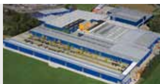
Hörmann KG Brockhagen, Germania