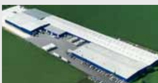
Hörmann LLC, Montgomery IL, USA