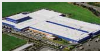
Hörmann KG Ichtshausen, Germania