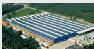
Hörmann Genk NV, Belgio