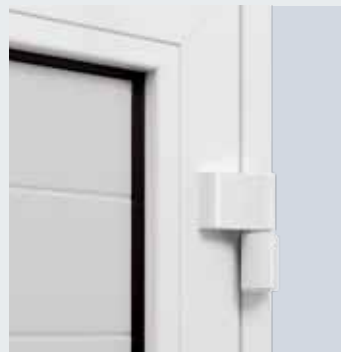
Cerniere regolabili su 3 dimensioni