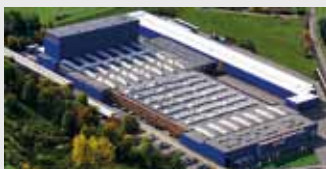
Hörmann KG Freisen, Germania