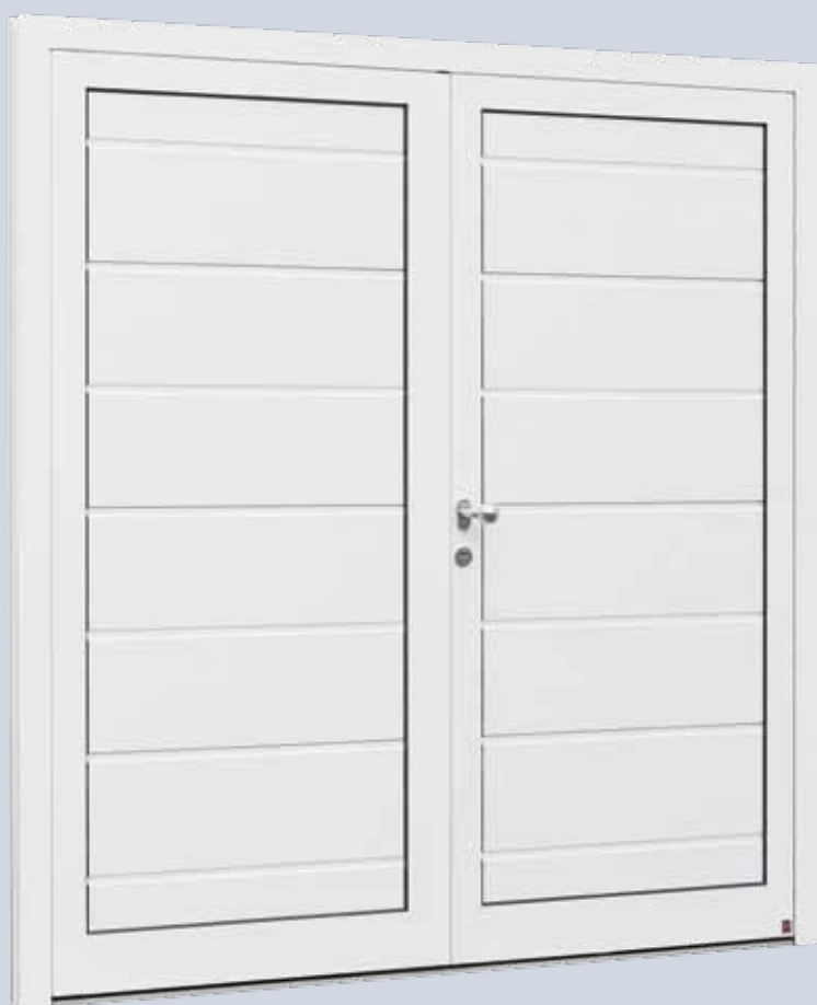
Porta da garage NT 80-2