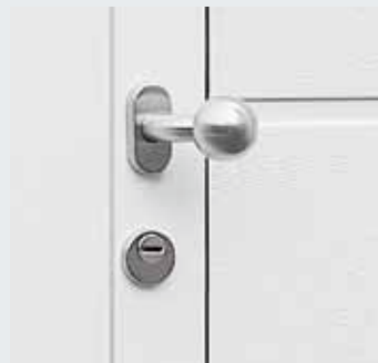
Corredo in acciaio inox (su richiesta)