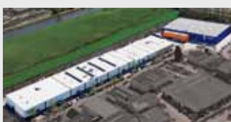
Hörmann Alkmaar B.V., Paesi Bassi