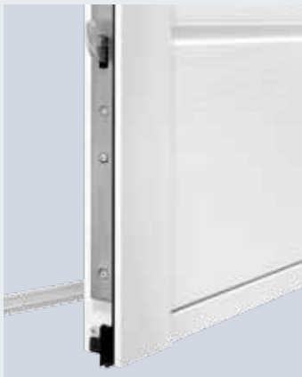
Un chiavistello rotante sotto e sopra