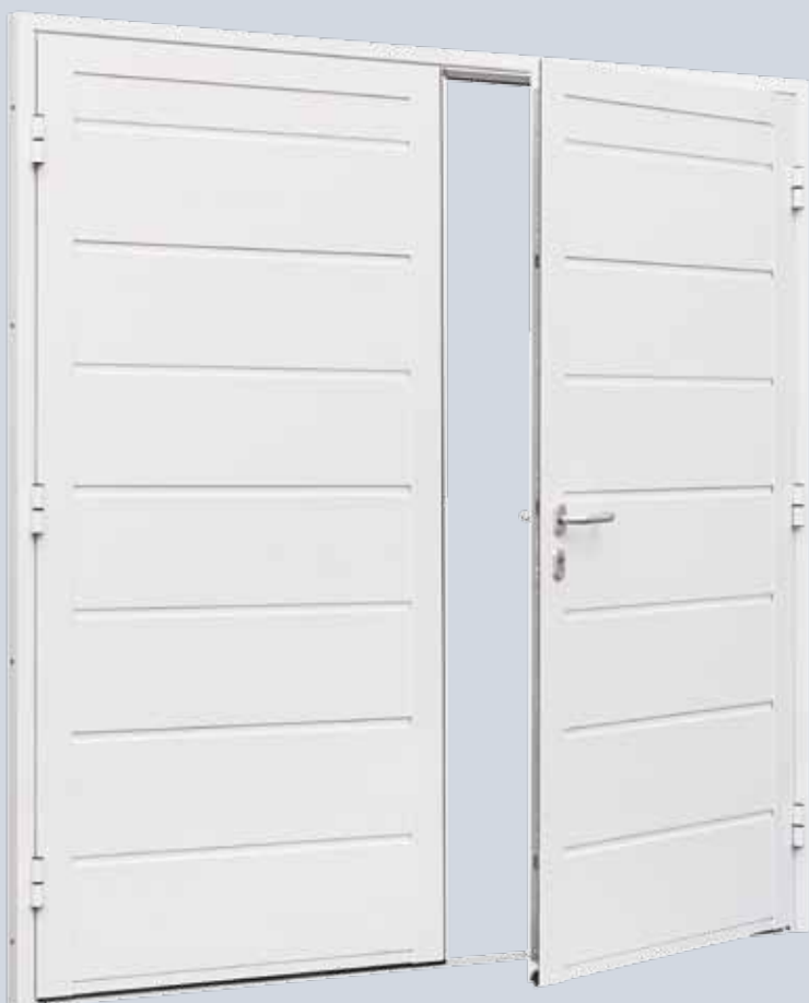
Porta da garage NT 60-2