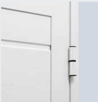
3 cerniere a 2 ali