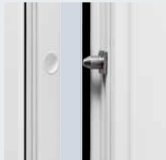
Perno di sicurezza