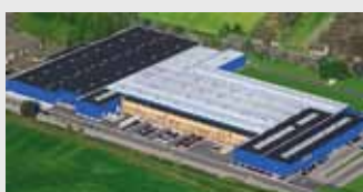
Hörmann KG Werne, Germania