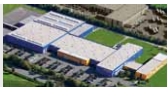
Hörmann KG Antriebstechnik, Germania