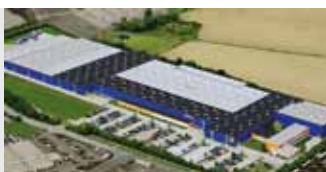
Hörmann KG Brandis, Germania