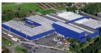
Hörmann KG Amshausen, Germania