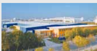
Hörmann Beijing, Cina