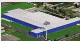
Hörmann KG Dissen, Germania