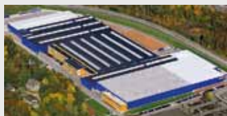
Hörmann KG Eckelhausen, Germania