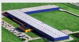
Hörmann Legnica Sp. z o.o., Polonia