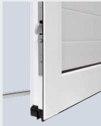
5 punti di bloccaggio e 3 chiavistelli rotanti