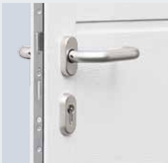
Maniglia in alluminio