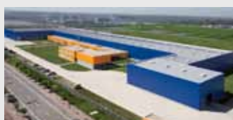
Hörmann Tianjin, Cina